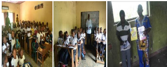
De gauche à droite, environnement scolaire après l'appui de CEF-JDD