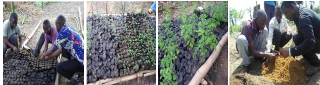
De gauche à droite, les pépinières des plantules de CEF-JDD

CEF-JDD a dans sa vision, « un monde sain dans un environnement sain » dans un univers qui aujourd'hui est victime des conséquences du changement climatique. Le projet de reboisement dans le site de Lukungu et le site de Nyoka où nous avons installé deux pépinières d'arbres ( Acacia ssp , Moringa oleifera , Trema orientalis , Mangifera indica , Avocatier, Mandarinier, Oranger) et quelques espèces forestières locales pour les expérimentations. Ce projet vise à planter les arbres dans les cours des écoles, espaces inexploités, sur les collines et à travers différentes routes