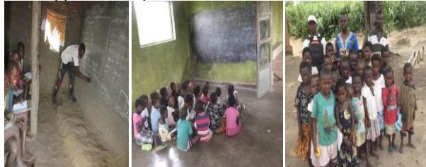
De gauche à droite, l'état de l'environnement des écoles avant l'appui.

A travers ce programme, dix-sept écoles (EP SOWEGARE, EP Kingombe, INSTITUT Kama II, Institut Mabala, EP Mamboleo, EP Mambe, EP Ponyo, EP Kasuku, Institut de Basoko, Institut Buve, Institut Rive Gauche, EP Lunungu, EP Kivuvu, EP KABALA, CS Shaloom, CS Kilimandjaro et CS Carmel dans les Province de Tanganyika, Maniema et Bandundu ont bénéficièrent de notre appui technique et matériel.