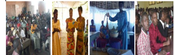
De gauche à droite, une séance de sensibilisation sur le genre, alphabétisation, exposition des œuvres d'une bénéficiaire et l'atelier de jeunes de la CEPGL.