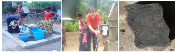
De gauche à droite, les puits construits par CEF-JDD dans le Village de Kikuni au Maniema et pavé recyclé à partir des déchets plastiques à Uvira.

L'accès à l'eau potable, à un assainissement adapté est un besoin vital et aussi fondamental en ce qu'il préserve l'environnement et évite les contaminations ultérieures. Enfin, la promotion de l'hygiène est bien souvent l'un des moyens de prévention les plus efficaces face aux risques sanitaires liés aux maladies d'origine hydrique. Le secteur WASH de CEF-JDD poursuit l'objectif d'approvisionnement en eau, la réduction des risques sanitaires dans l'impact des maladies d'origine hydrique et l'assainissement de l'environnement par le recyclage des déchets.