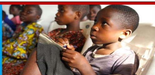
ACTIVITE DE RENFORCEMENT SCOLAIRE DES ENFANTS