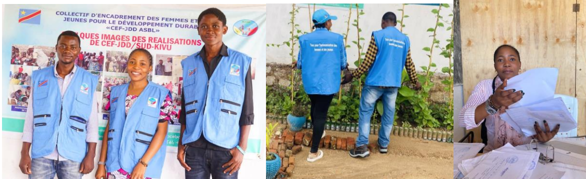
Equipe CEF-JDD : nous formons les jeunes à devenir de bons citoyens et bonnes citoyennes pour aider la RDC

Nos atouts : CEF-JDD est une organisation officiellement reconnue en République Démocratique du Congo. CEF-JDD est membre actif des clusters : Protection, Sécurité alimentaire, Wash, Education, Santé et Nutrition.