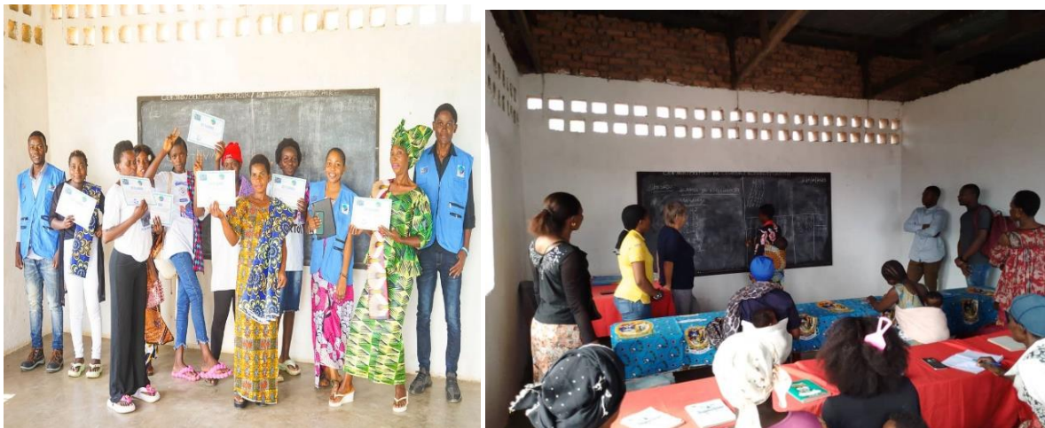
Les lauréates de la formation d'alphabétisation recevant leurs certificats de formation

En suivant ces recommandations, l'Association pour le Développement et l'Autonomisation des Communautés pourra continuer à jouer un rôle crucial dans l'amélioration des conditions de vie des populations les plus vulnérables en République Démocratique du Congo.