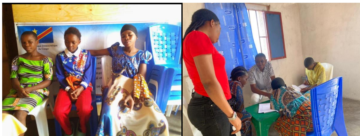
Enfants séparés de leurs familles bénéficiant de l'accompagnement de CEF-JDD dans son centre de l'espoir

L'année 2023 a été une année fructueuse pour notre association, marquée par des projets significatifs qui ont contribué à améliorer la vie des communautés vulnérables dans plusieurs régions de la RDC. Nous restons engagés dans notre mission et espérons continuer à avoir un impact positif dans les années à venir.