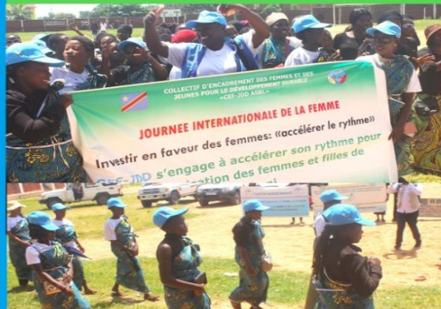
ACTIVITE DE LA JOURNEE MONDIALE DE LA FEMME