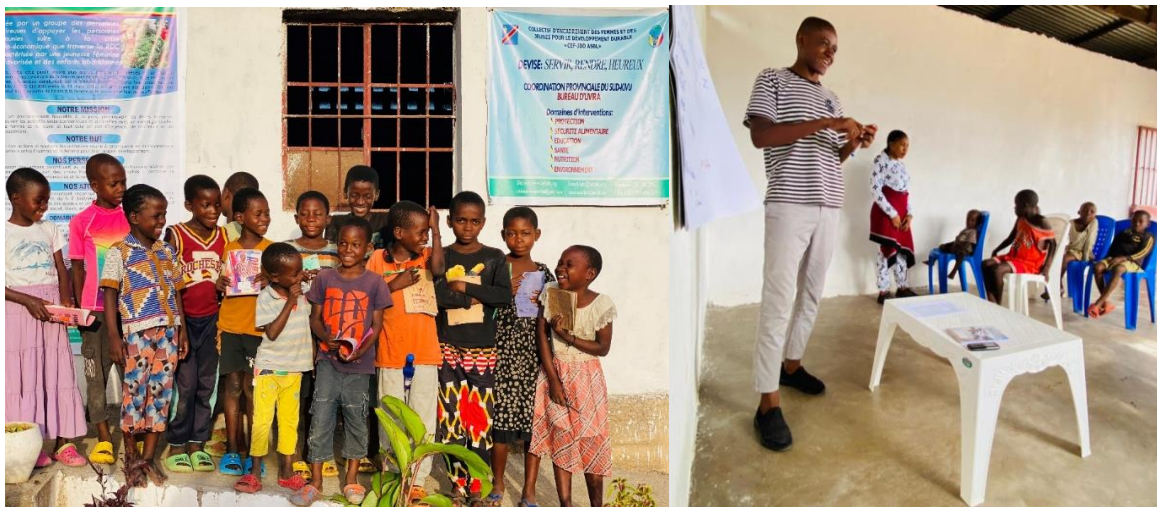
Enfants bénéficiant du programme de renforcement scolaire donné par CEF-JDD

En fin, CEF-JDD aborde l'avenir avec optimisme et détermination, consciente des défis à relever mais également des opportunités à saisir pour continuer à œuvrer en faveur du développement et de l'autonomisation des communautés vulnérables.