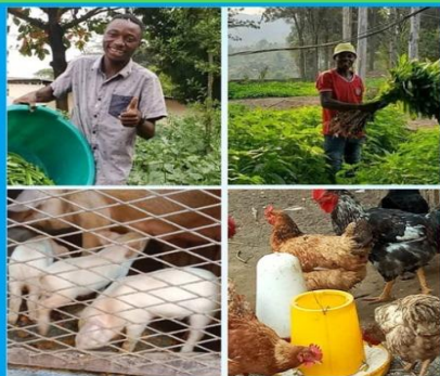
FORMATION EN AGRICULTURE ET ELEVAGE