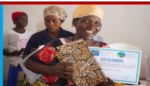
ACTIVITE DE RENFORCEMENT SCOLAIRE DES FEMMES ANALPHABETES