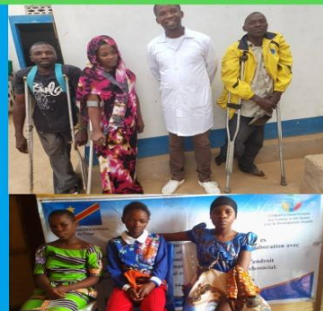
ASSISTANCE ET INCLUSION GENRE