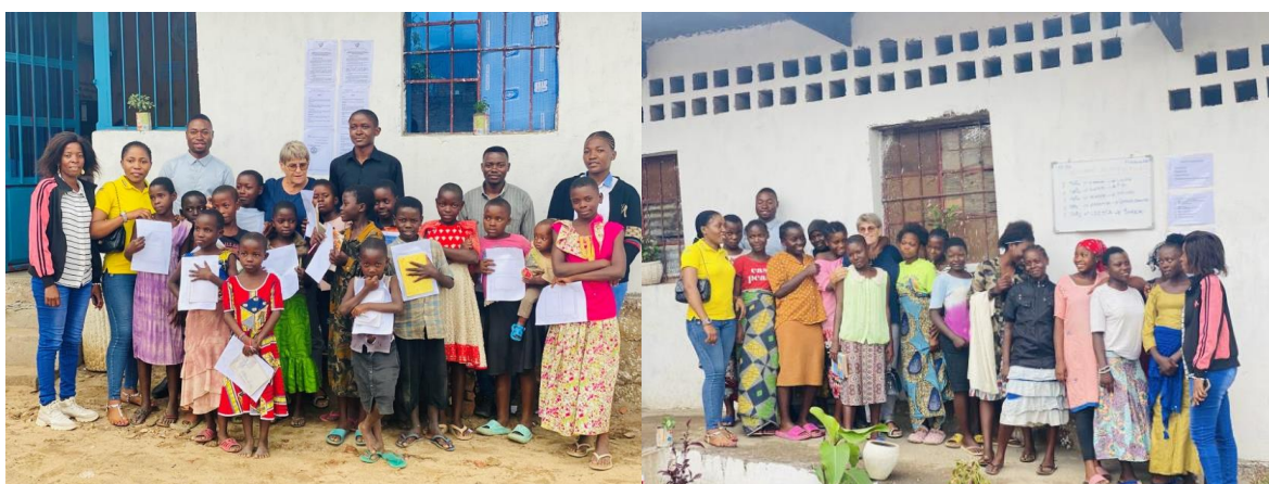
Visite de la consultante de GIZ au bureau CEF-JDD Uvira, photo CEF-JDD 2023