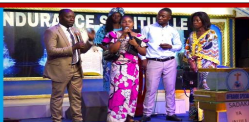
CAMPAGNE DE 16 JOURS D'ACTIVISME DE LUTTE CONTRE LE VBG